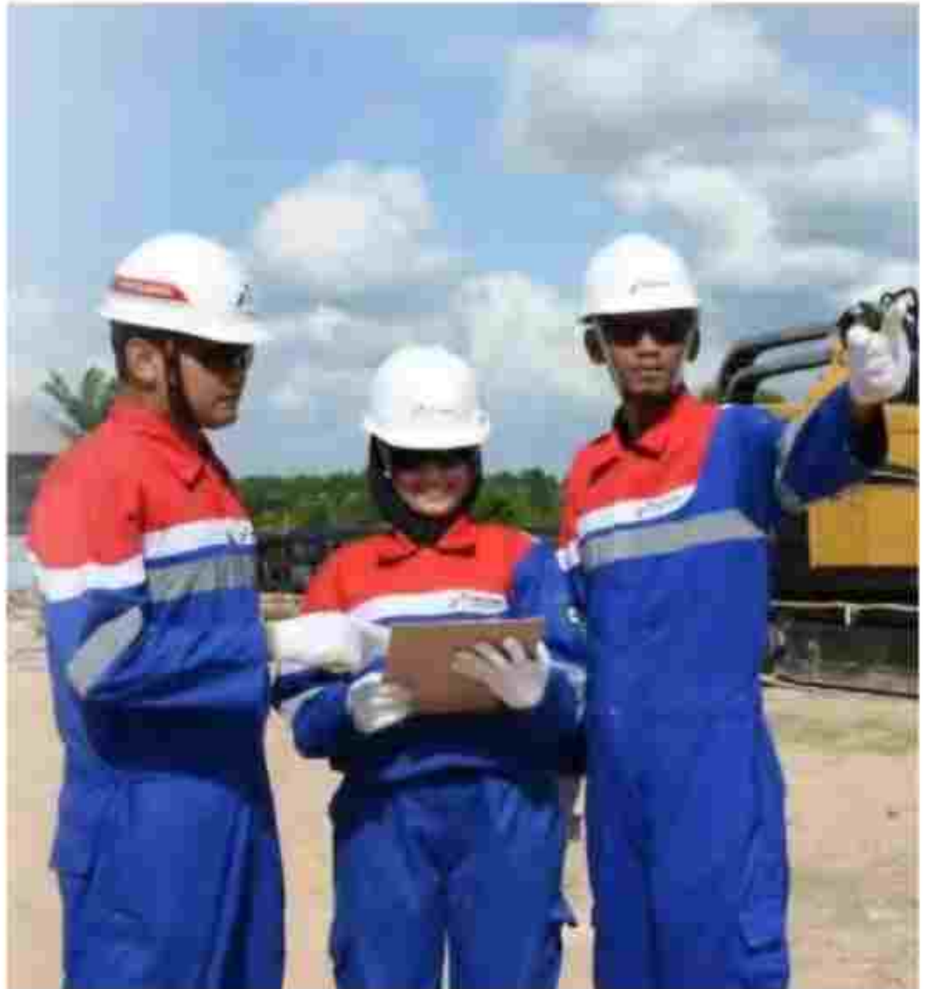
Ilustrasi - Karyawan PT Patra Drilling Contractor (PDC), anak perusahaan PT Pertamina Drilling Services Indonesia yang tergabung dalam Subholding Upstream Pertamina, sedang beraktivitas.

"Kami siap dan optimistis memenuhi target 2025 dengan beberapa strategi yang telah kami tetapkan, utamanya dengan terus mengedepankan kompetensi, inovasi, efisiensi dan keberlanjutan," ungkap Faried. (arm)