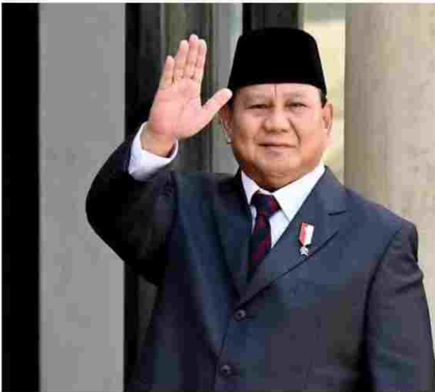
Presiden RI Prabowo Subianto memilih tanggal 20 Februari 2025 untuk digelar pelantikan kepala daerah.

Keputusan ini diambil menyusul jadwal pembacaan putusan dismisal untuk 310 sengketa pilkada oleh MK pada tanggal