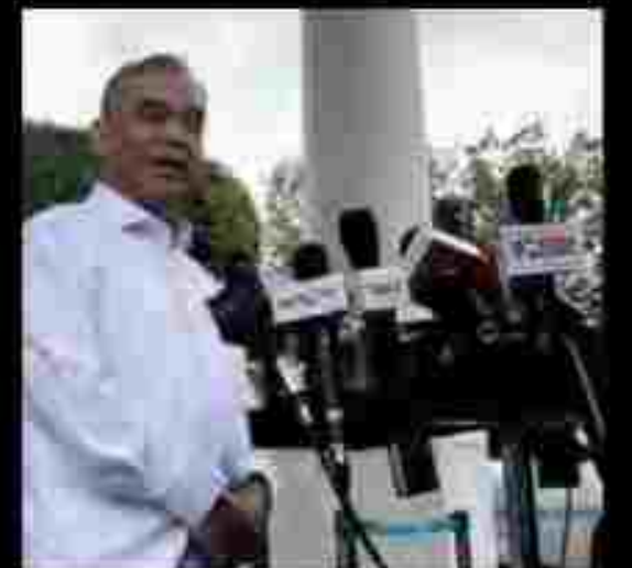
Sekretaris Jenderal DPP Partai Gerindra Ahmad Muzani memberikan keterangan pers di Istana Kepresidenan Jakarta, Senin (3/2/2025).

"Insyallah kegiatan ulang tahun Partai Gerindra