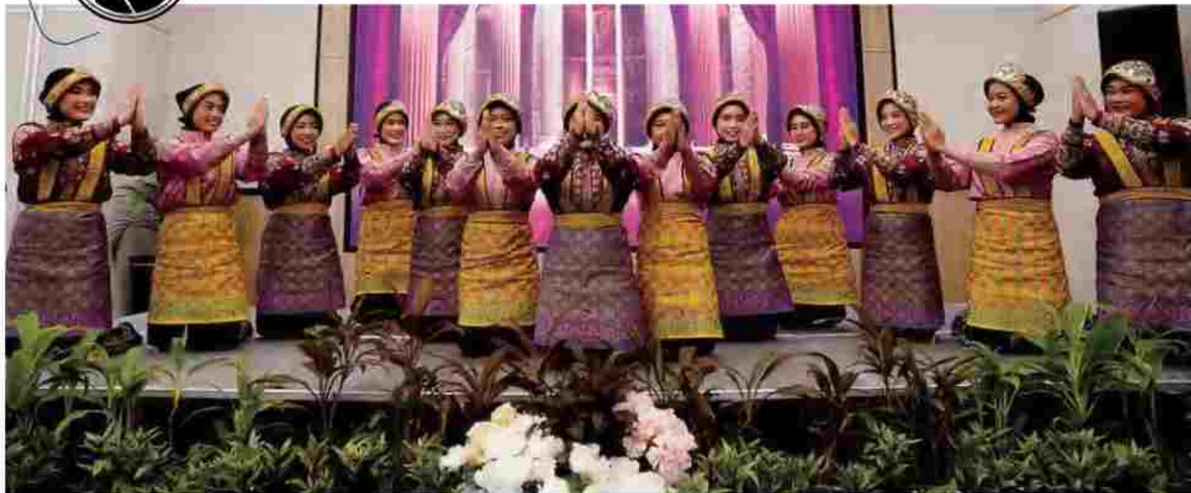
Tarian daerah asal Aceh ikut meriahkan HUT INDOPOSCO ke-4