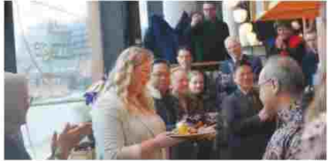
Duta Besar RI untuk Norwegia Teuku Faizasyah meresmikan pembukaan restoran Indonesia bernama "Boboko" di VIA Village, salah satu kawasan perkantoran dan pusat restoran di kota Oslo, Norwegia.