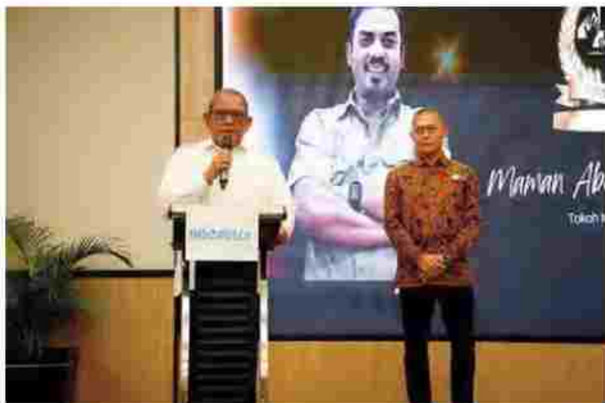
Staf Khusus Kementerian UMKM mewakili Menteri UMKM Maman Abdurachman menerima penghargaan dari INDOPOSCO