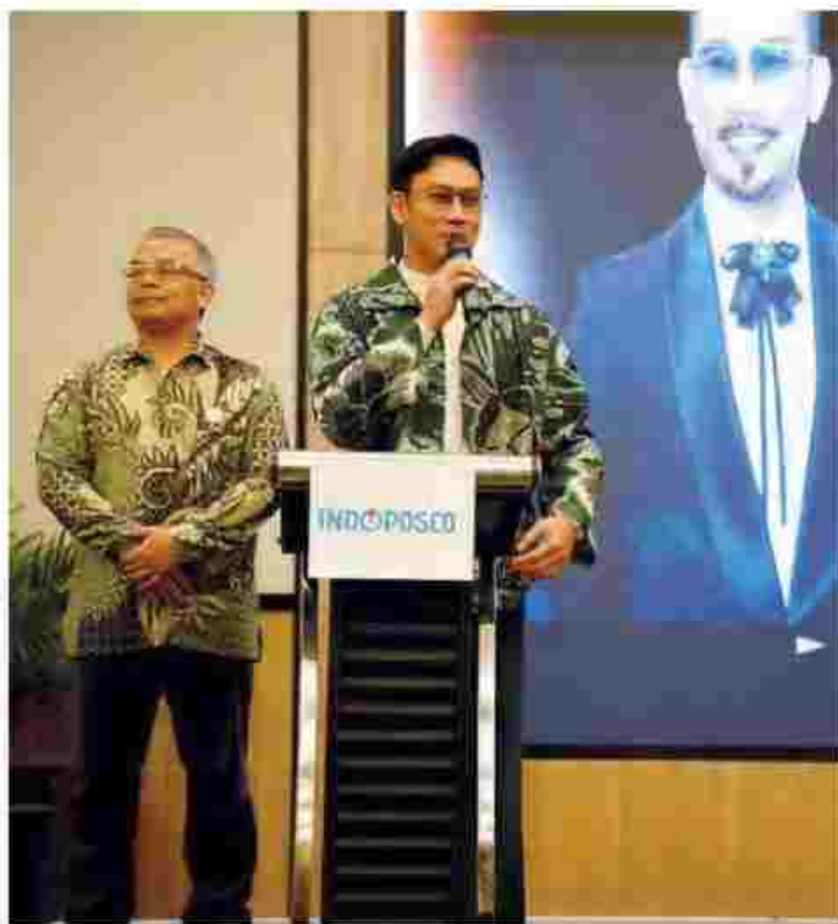
Denny Sumargo saat menerima penghargaan di acara INDOPOSCO AWARDS 2025.

Dengan ketekunan dan kreativitasnya, Denny Sumargo terus berkembang dan menjadi salah satu figur publik yang berpengaruh di dunia hiburan dan digital Indonesia. (ney)