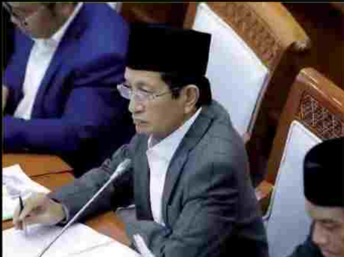
Menteri Agama Nasaruddin Umar saat rapat kerja dengan Komisi VIII DPR di Jakarta, Senin (3/2/2025).

Anggaran tersebut didapat dengan memperhitungkan ketersediaan sebagian anggaran untuk