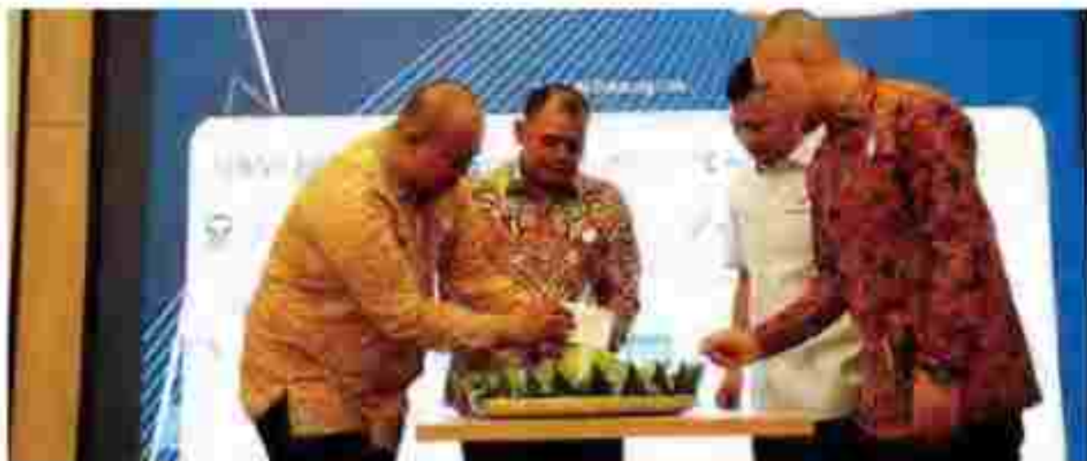
Jajaran direksi INDOPOSCO melakukan pemotongan tumpeng dalam acara HUT INDOPOSCO ke-4