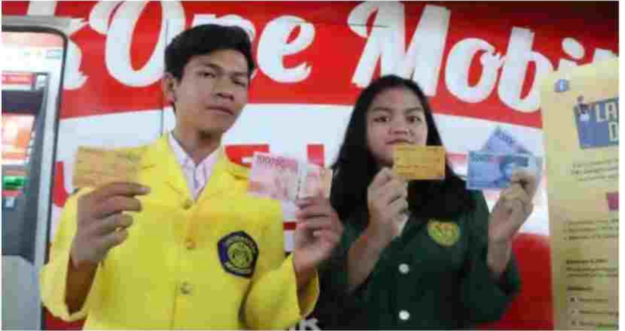
Mahasiswa dan Mahasiswi memperlihatkan Kartu Jakarta Mahasiswa Unggul (KJMU), yang baru diterimanya di Jakarta, Rabu (4/3/2024).

Meskipun demikian, Sarjoko menjelaskan proses evaluasi tetap akan dilakukan secara per