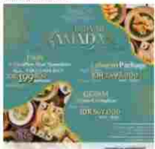
Horison Ultima Suites & Residences Rasuna Jakarta menawarkan paket khusus Gebyar Ramadan 1446 H.

Mari buat kenangan yang tidak terlupakan di Bulan Suci Ramadan dan Hari Raya Idulfitri bersama dengan Hotel Horison Ultima Suites & Residences Rasuna, Jakarta. (stv)