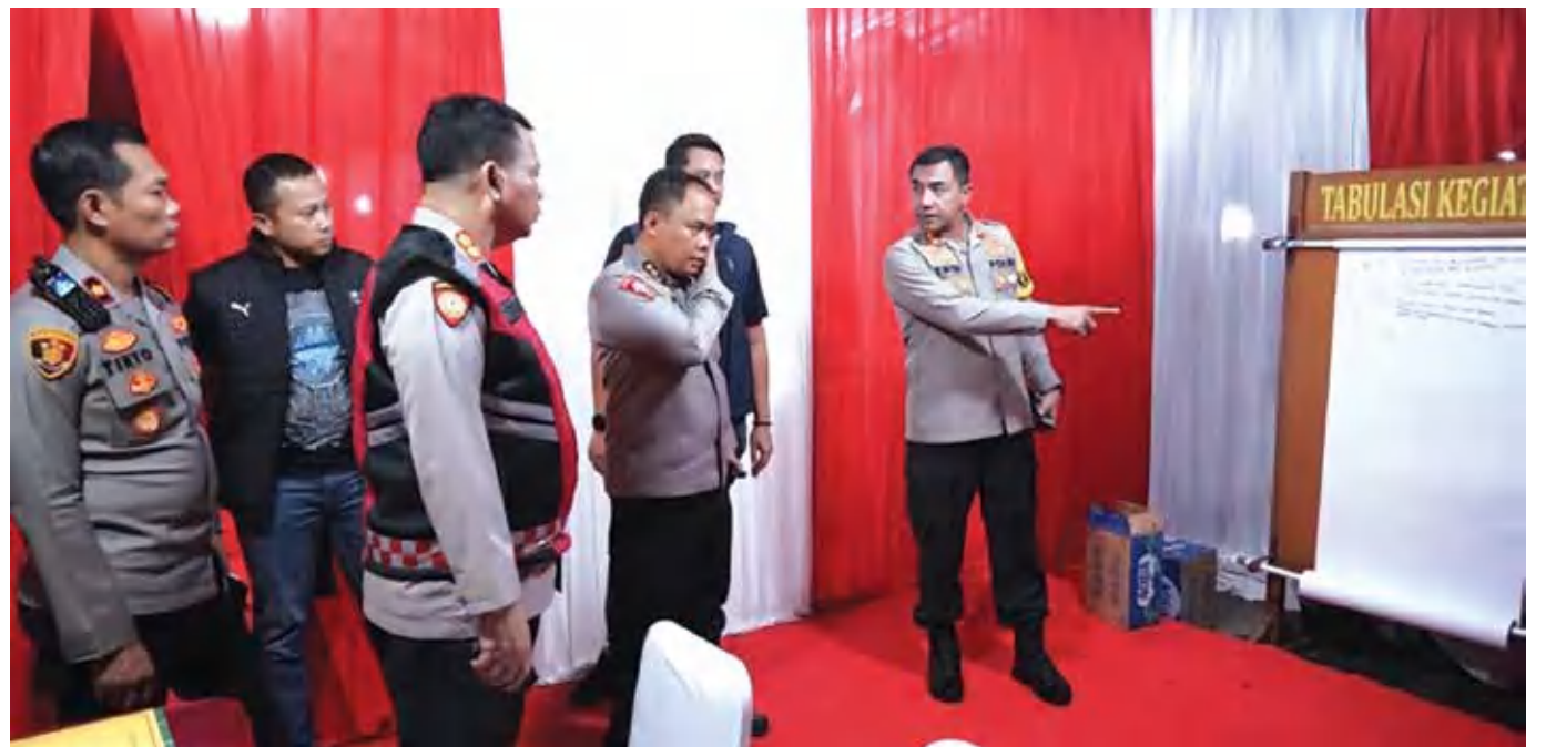
Kepala Kepolisian Resor (Kapolres) Metro Bekasi Komisaris Besar Polisi Ttwedi Aditya Bennyahdi (kanan) saat memberikan arahan kepada petugas di pos pengamanan Gedung Juang Tambun, Kabupaten Bekasi, Sabtu (21/12/2024).

Operasi Lilin Jaya 2024 berlangsung mulai 22 Desember 2024 hingga 2 Januari 2025, dengan fokus pengamanan di 11 sektor utama, termasuk transportasi, tempat wisata dan pusat ibadah.(arm)