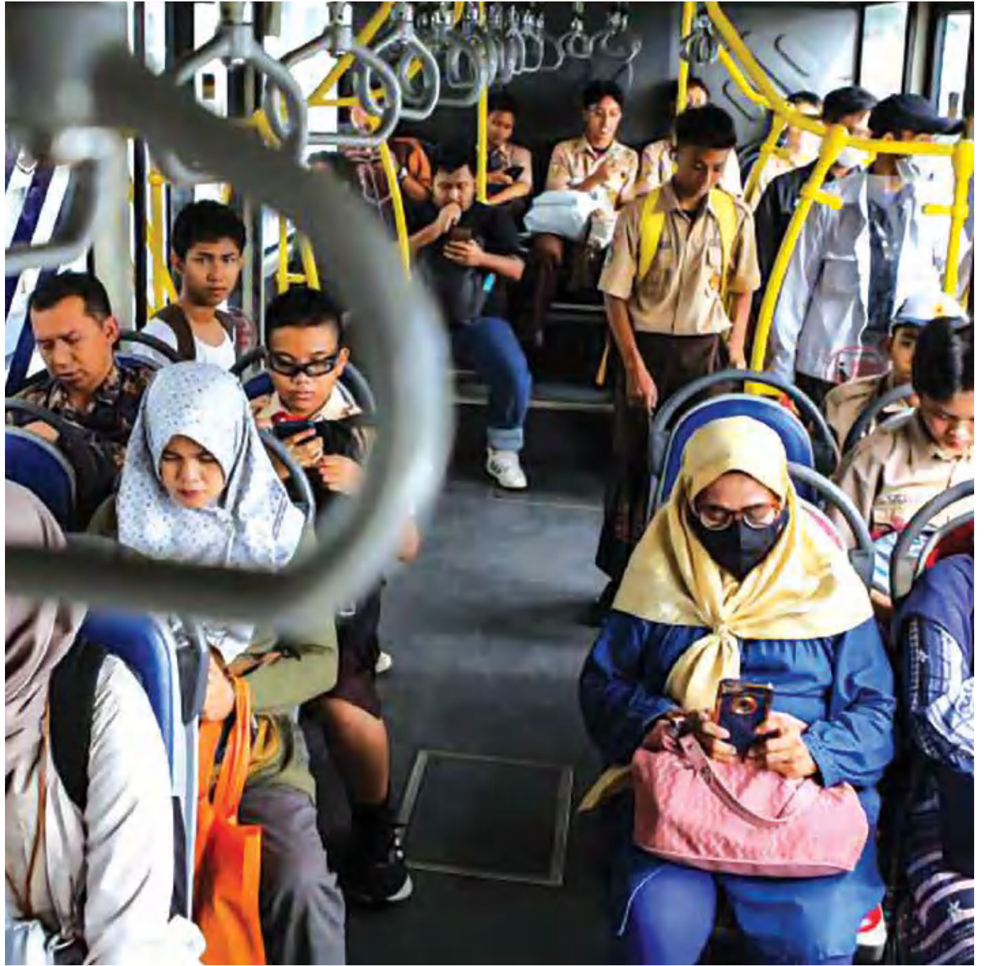
Sejumlah penumpang menaiki bus Transjakarta di Jakarta, Rabu (13/11/2024).

Jika tarif dinaikkan, menurut dia, ada risiko sebagian masyarakat akan kembali menggunakan kendaraan pribadi sehingga dapat memperburuk kemacetan dan meningkatkan polusi udara.