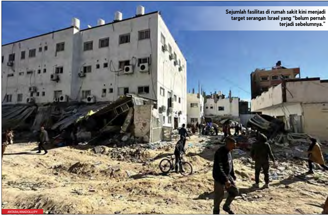
Sejumlah fasilitas di rumah sakit kini menjadi target serangan Israel yang "belum pernah terjadi sebelumnya."