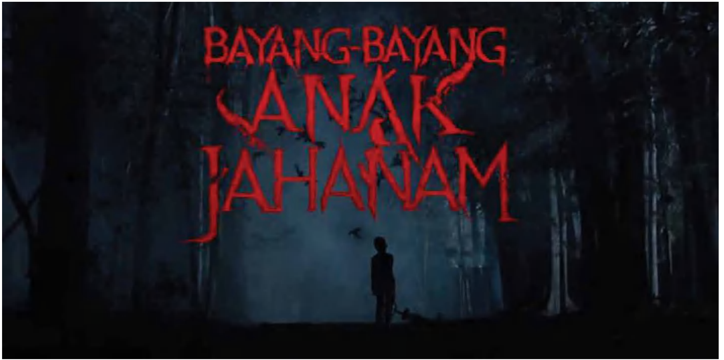
Poster film "Bayang-Bayang Anak Jahanam."