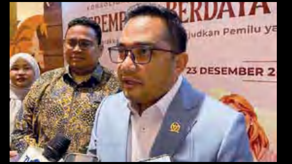
Ketua Komisi II DPR RI Muhammad Rifqinizamy Karsayuda menjawab pertanyaan wartawan di Badung, Bali, Minggu (22/12/2024).

Menurut dia, terdapat hal yang lebih substantif daripada mengkhawatirkan ada atau tidaknya tugas KPU dan Bawaslu setelah tahapan pemilu. Salah satunya, yaitu menata sistem kepemiluan dengan mempertimbangkan perubahan jadwal pemilihan. "Saya kira, kita juga perlu untuk merenungkan apakah jadwal pileg, pilpres, dan pilkada di satu tahun yang sama dengan konsekuensi adanya tumpang tindih tahapan di beberapa tempat, itu apa perlu kita evaluasi atau tidak? Kalau itu perlu kita evaluasi, maka akan ada kemungkinan jadwal pilkada itu tidak di tahun yang sama dengan pileg dan pilpres," katanya. (dam)