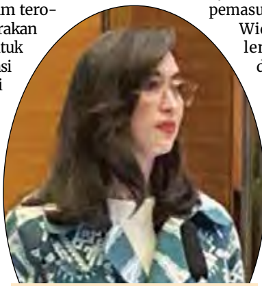
Menteri Pariwisata Widiyanti Putri Wardhana saat menjabarkan capaian sektor pariwisata dalam Jumpa Pers Akhir Tahun (JPAT) 2024 di Jakarta, Jumat (20/12/2024).

"Program-program ini diharapkan dapat membantu percepatan pertumbuhan ekonomi berbasis masyarakat desa, sekaligus meningkatkan desa wisata berprestasi di mata internasional," kata dia. (wib)