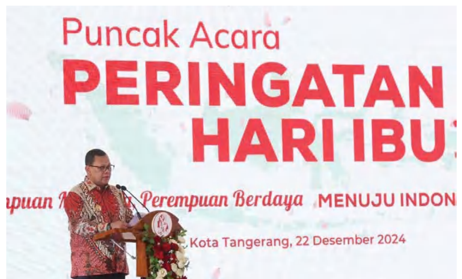
Penjabat (Pj) Gubernur Banten A Damenta menghadiri peringatan hari ibu di Puspemkot Tangerang.

"Setiap tanggal 22 Desember telah ditetapkan sebagai Hari Ibu yang merupakan momentum penting untuk mengapresiasi peran, dedikasi, serta perjuangan perempuan Indonesia dengan berjuang bersama-sama kaum laki-laki dalam merebut kemerdekaan dan meningkatkan kualitas hidup masyarakat," jelasnya. (yas)