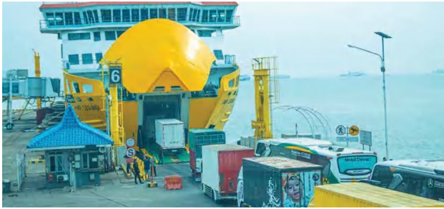
Kendaraan dari Pelabuhan Merak berjalan lancar naik ke atas kapal untuk menuju Pelabuhan Bakauheni, Lampung.