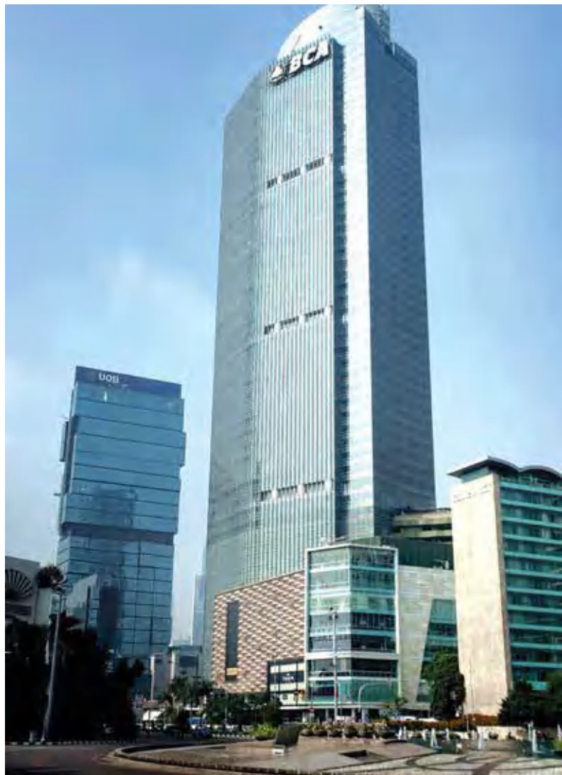
Lanskap Menara BCA.

SKK Migas berkomitmen untuk terus bekerja sama dengan para pemangku kepentingan dalam mewujudkan target produksi nasional, menciptakan kedaulatan energi, dan memastikan kontribusi sektor hulu migas terhadap kemajuan Indonesia.(arm)