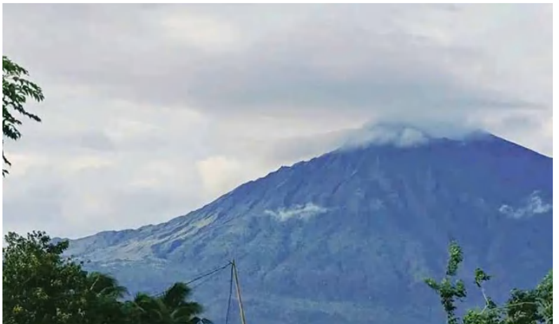
Gunung Rinjani Lombok, Nusa Tenggara Barat.

"Pendakian terakhir dilakukan pada akhir bulan Desember 2024," katanya. (wib)