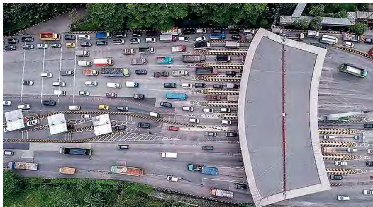
Foto udara kendaraan antri memasuki Pintu Tol Cikupa, Kabupaten Tangerang, Banten, Sabtu (21/12/2024).

persen jika dibandingkan lalin normal (598.904 kendaraan) pada periode yang sama. Jika dibandingkan dengan periode Natal 2023, total volume lalin ini meningkat sebesar 5,8 persen (648.813 kendaraan). Untuk distribusi lalu lintas ■ » Baca Ramai Hal 11