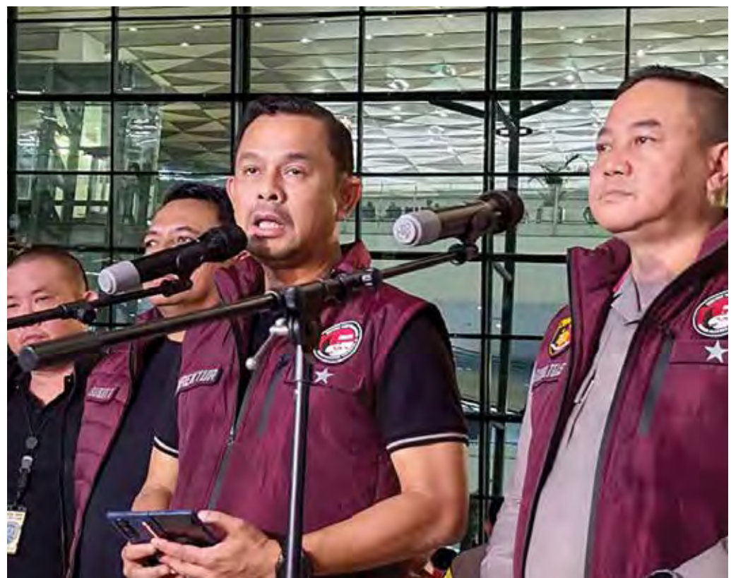
Dirtipid Narkotika Bareskrim Polri Brigjen Pol. Mukti Juhasa memberikan keterangan pers pada saat pemulangan seorang pria berinisial RN warga negara asing (WNA) sebagai terduga pengendali praktik clandestine lab yang berbasis di Kabupaten Badung, Bali, Minggu (22/12/2024).

“Sekarang kami akan bawa ke Bareskrim untuk dilakukan pemeriksaan lebih lanjut,” kata dia. (dam)