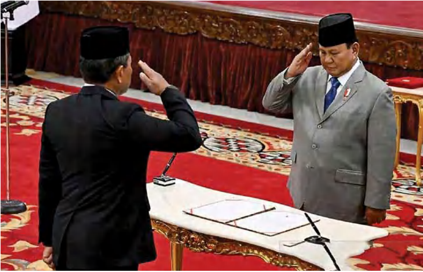
Presiden Prabowo Subianto (kanan) membalas penghormatan Wakil Menteri Pertahanan Donny Ermawan sebelum penandatanganan berita acara pelantikan Donny sebagai Sekretaris Dewan Pertahanan Nasional di Istana Negara, Senin (20/12/2024). Presiden melantik Sjafrie Sjamsoeddin sebagai Ketua Harian Dewan Pertahanan Nasional dan Wakil Menteri Pertahanan Donny Ermawan sebagai Sekretaris Dewan Pertahanan Nasional.

susunan organisasi DPN terdiri atas Ketua DPN yang dijabat oleh Presiden, anggota tetap, dan anggota tidak tetap.