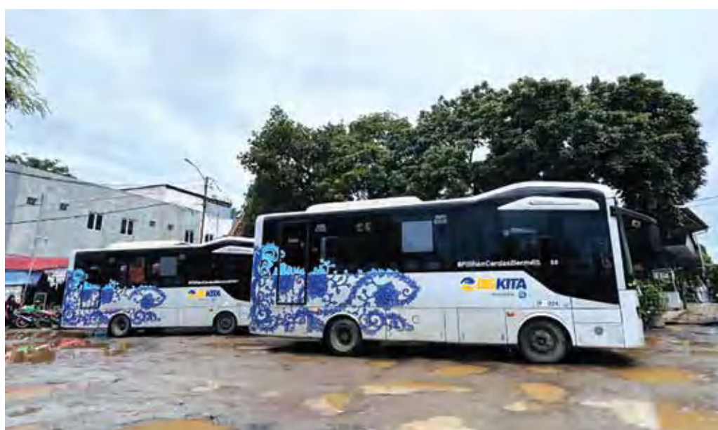
Ilustrasi transportasi massal Biskita Transpakuan di Kota Bogor.

"Itu silahkan berkoordinasi dengan Dinas Perhubungan. Kami dari DPRD siap mendukung Organda. Jadi kita punya program yang dibangun dari bawah, tidak hanya ngambil dari pusat," katanya.(arm)