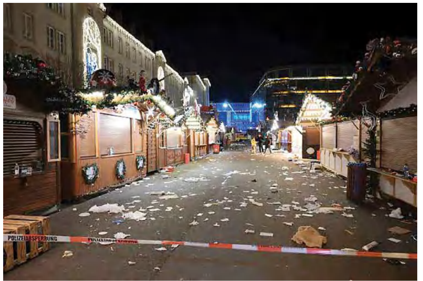
Warga berkumpul di Pasar Natal Magdeburg usai diserang teroris.

"tidak beriman" dari Arab Saudi. Ketua Jumat (20/12) malam, penyiar NTV Jerman melaporkan bahwa sebuah mobil menabrak kerumunan di pasar Natal di Magdeburg. Pada Sabtu, Menteri-Présiden