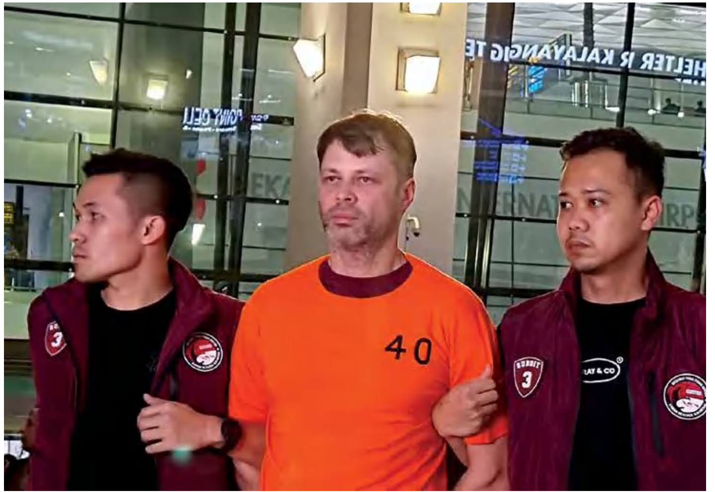
Direktorat Tindak Pidana Narkotika Bareskrim Polri, memulangkan seorang pria berinisial RN warga negara asing (WNA) sebagai terduga pengendali praktik clandestine lab yang berbasis di Kabupaten Badung, Bali dari Thailand melalui Bandara Internasional Soekarno-Hatta, Tangerang, Banten, Minggu (22/12/2024).

Ia mengungkapkan, setelah selesai dilakukan penyerahan dari pihak penegak keamanan negara Thailand, Polri langsung melakukan pemulangan ke Indonesia untuk dilakukan proses hukum sesuai undang-undang yang berlaku.