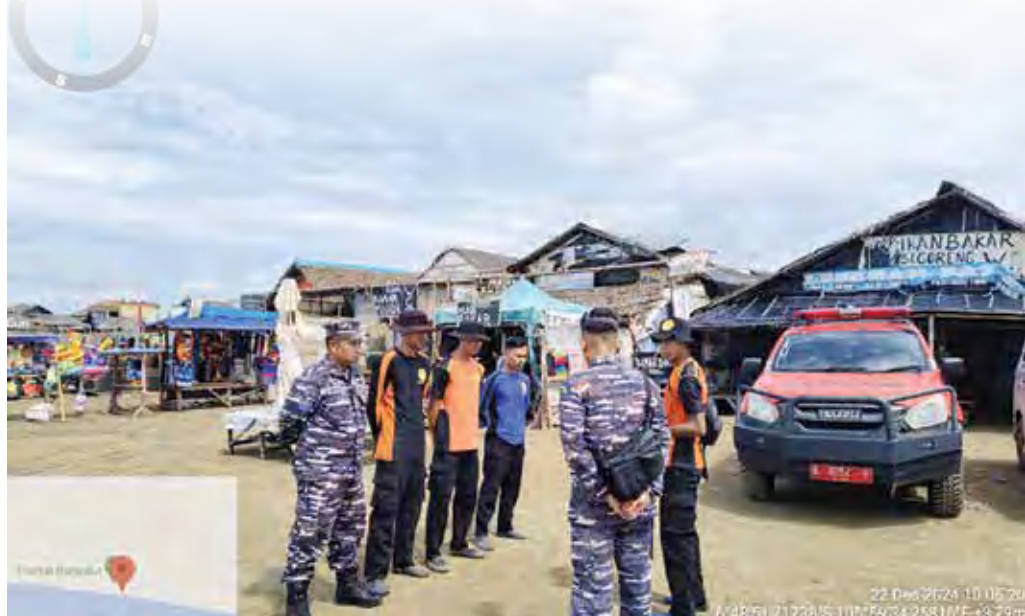
Tim Pencarian dan Pertolongan atau SAR Banten melakukan pencarian dan penyisiran seorang wisatawan yang tenggelam terseret ombak tinggi di sekitar Pantai Bagedur, Minggu (22/12/2024).

Pencarian korban difokuskan dengan melakukan penyisiran via darat dengan radius 1 km dari LKP dengan pencarian via laut tidak dilakukan dikarenakan tinggi gelombang antara 3 - 5 meter. (wib)