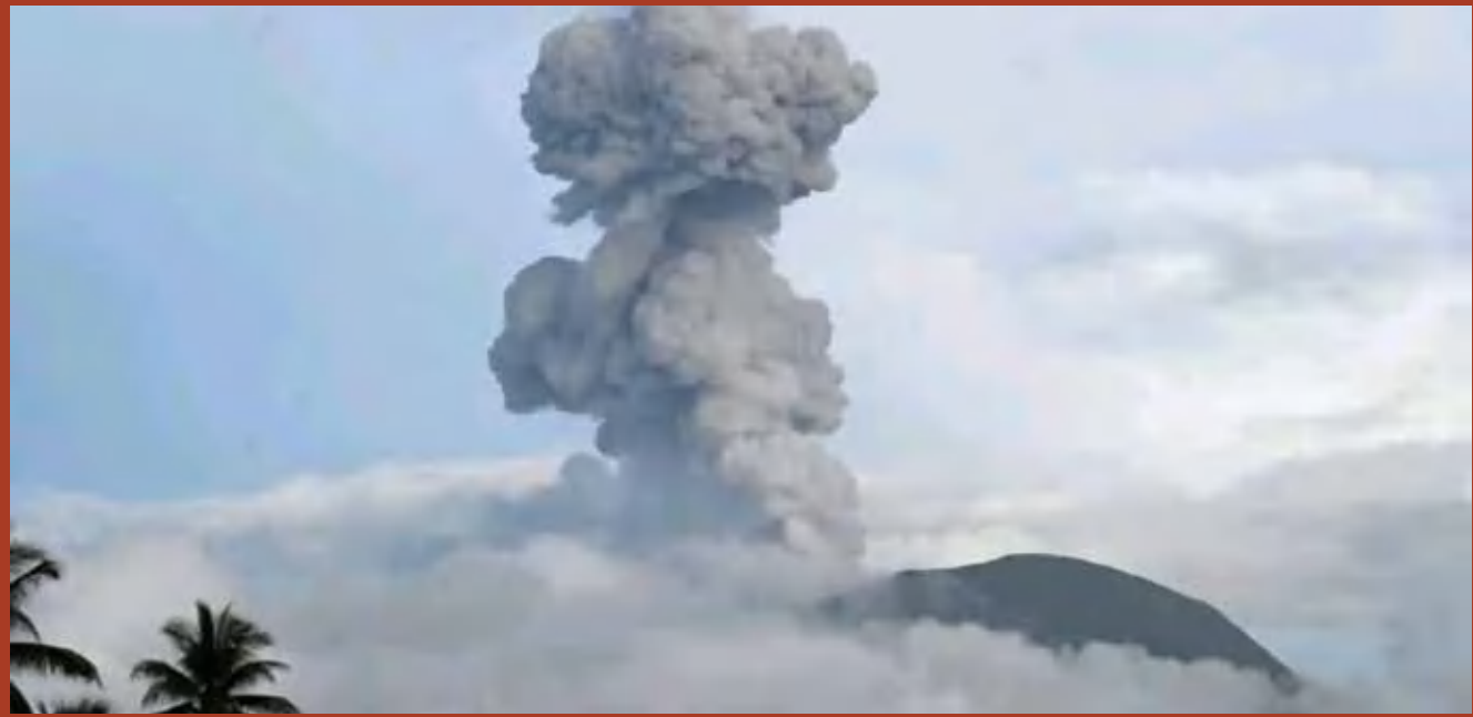
Gunung Ibu terlihat menyemburkan abu vulkanik setinggi 1.200 meter di atas puncak gunung, Minggu (22/12/2024).

Pemerintah Kabupaten Halmahera Barat agar senantiasa berkoordinasi dengan Pusat Vulkanologi dan Mitigasi Bencana Geologi di Bandung atau dengan Pos Pengamatan Gunung Ibu yang berada di Desa Gam Ici untuk mendapatkan informasi langsung tentang aktivitas gunung api itu. (bro)