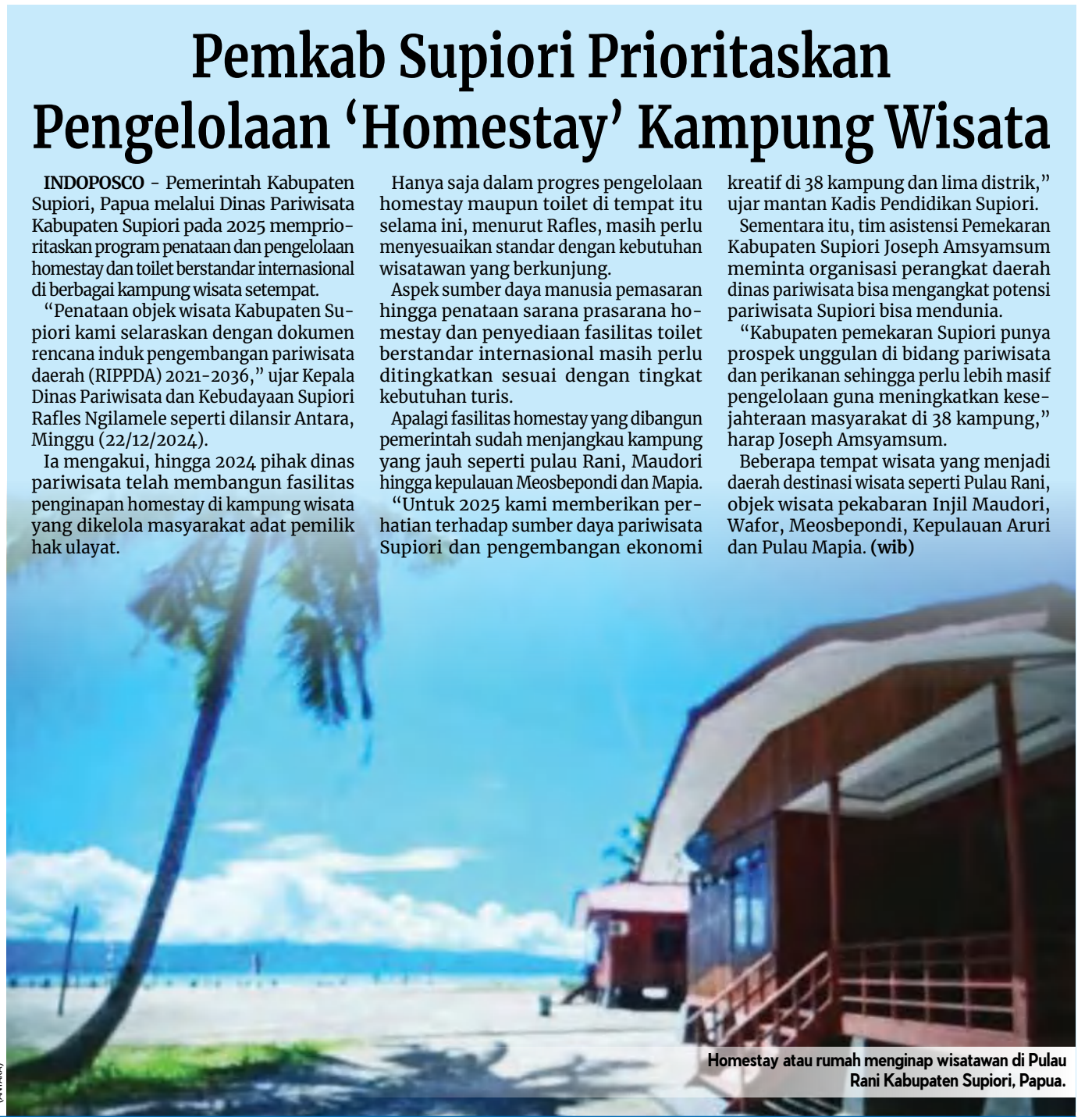
Homestay atau rumah menginap wisatawan di Pulau Rani Kabupaten Supiori, Papua.

Beberapa tempat wisata yang menjadi daerah destinasi wisata seperti Pulau Rani, objek wisata pekabaran Injil Maudori, Wafor, Meosbepondi, Kepulauan Aruri dan Pulau Mapia. (wib)