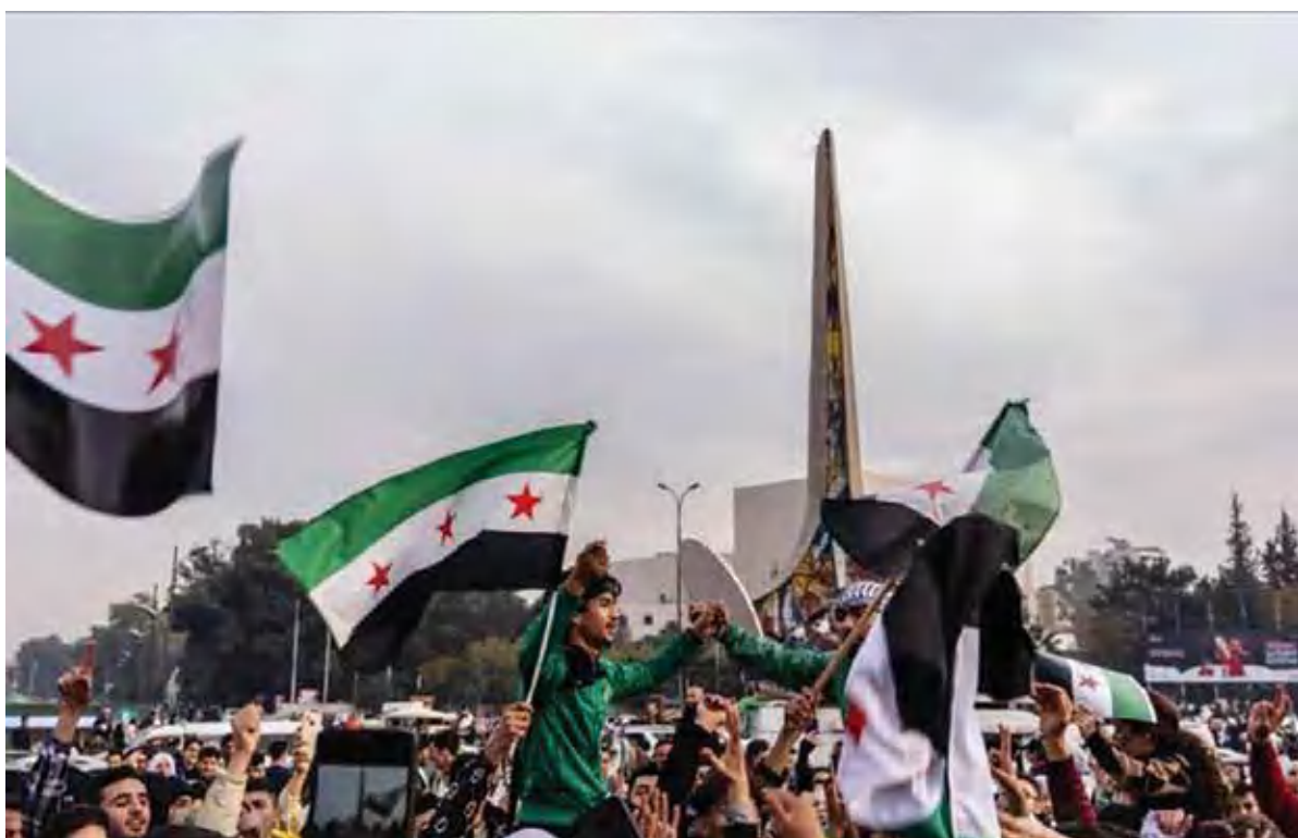
Euforia warga Suriah di tengah jalan usai berhasil menumbangkan rezim Bashar Al-Assad.

INDOPOS - Semenjak milisi Suriah menggulingkan pemerintahan Presiden Bashar Al-Assad pada 8 Desember, pasukan Israel menggencarkan serangan ke negara itu dan menerobos masuk wilayah yang sebelumnya merupakan zona demiliterisasi. milisi Suriah menggulingkan pemerintahan Presiden Bashar Al-Assad pada 8 Desember, pasukan Israel menggencarkan serangan ke negara itu dan menerobos masuk wilayah yang sebelumnya merupakan zona