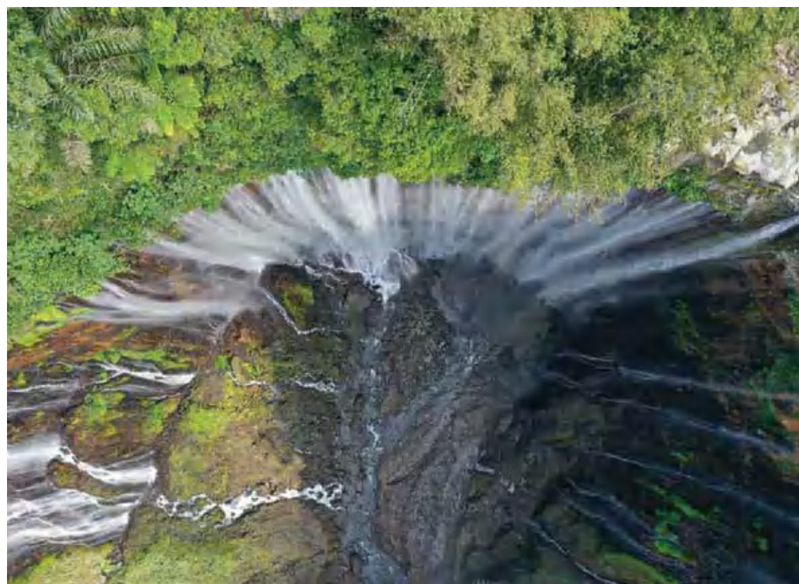
Air terjun Tumpak Sewu yang menjadi salah satu wisata primadona di Kabupaten Lumajang, Jawa Timur.

INDOPOSCO - Dinas Pariwisata Kabupaten Lumajang, Jawa Timur, langsung merespons keluhan seorang wisatawan terkait pungutan liar (pungli) saat mengunjungi Air Terjun Tumpak Sewu yang harus membayar tiket masuk hingga tiga kali.